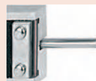
Provedení s kulatým hloubkoměrem