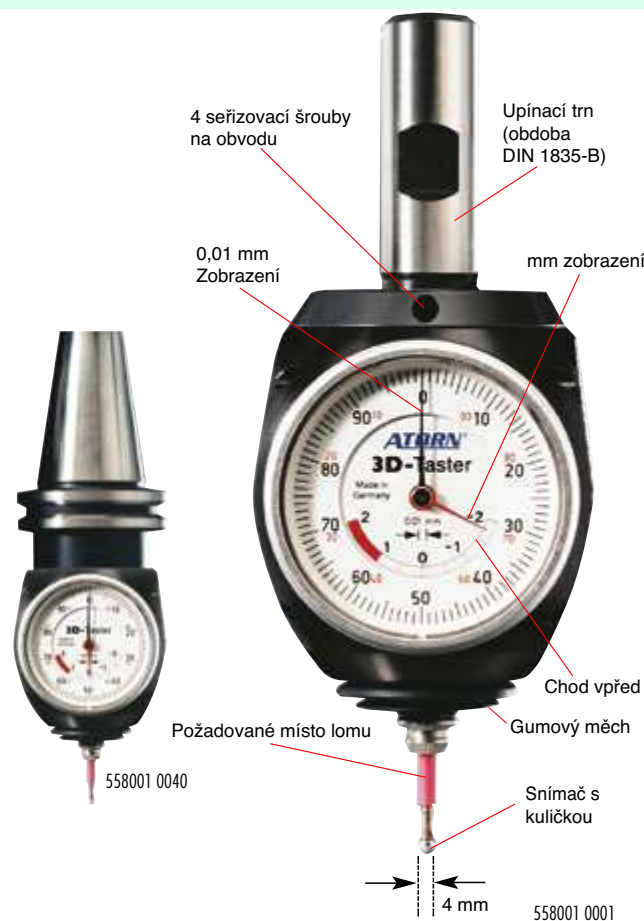
Když je malý a velký ukazatel na „nule“, potom je osa vřetene rovná ose dotyku. Řízení stroje se vynuluje.